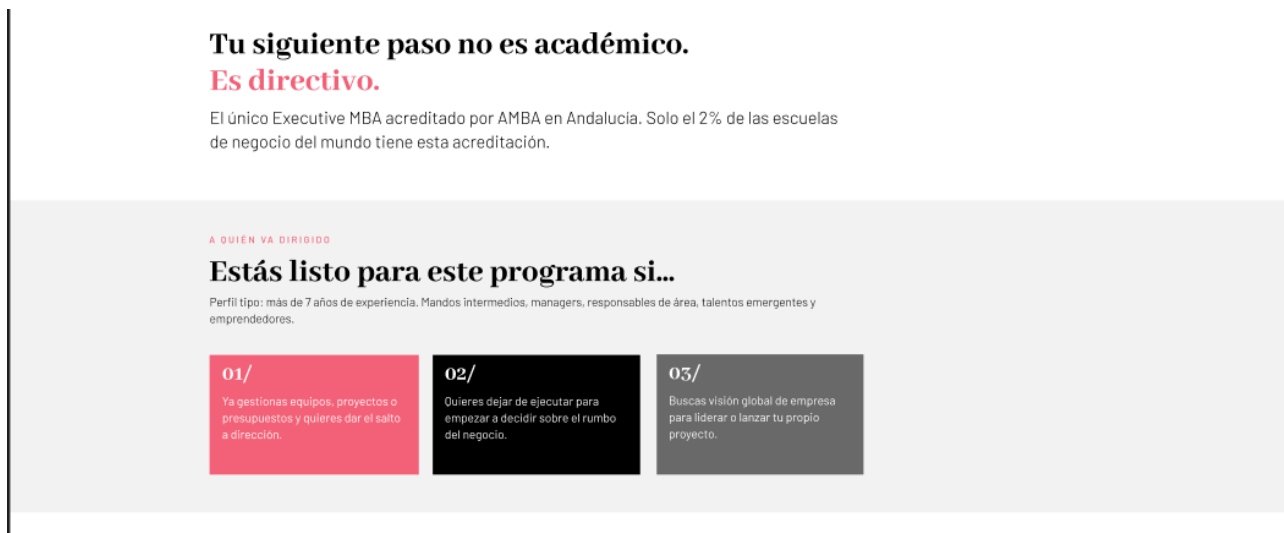
Referencia visual: Bloque Introducción.

Debe reproducirse la sección introductoria con titular, subtítulo y tarjetas de perfil del público objetivo.